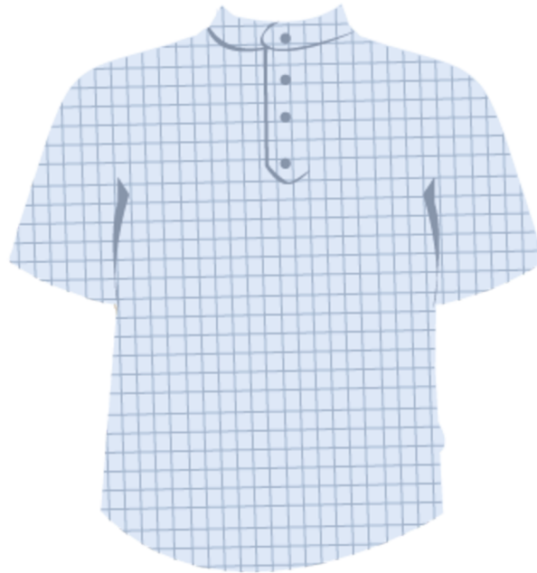
Chemise Vichy col Mao