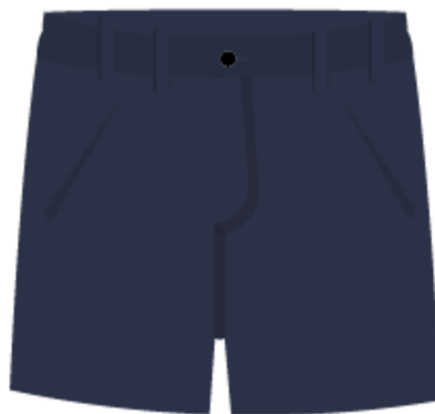
Bermuda bleu marine avec un élastique d'ajustement à la taille