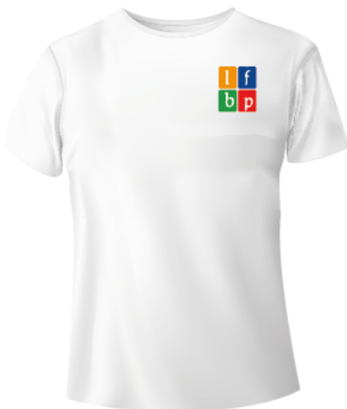
T-Shirt Blanc floqué avec le logo de l'établissement