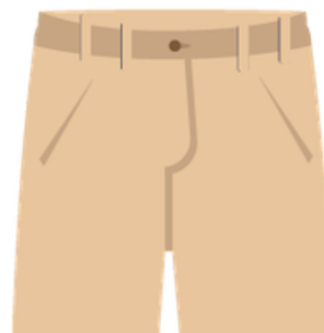
Short kaki classique longueur genoux