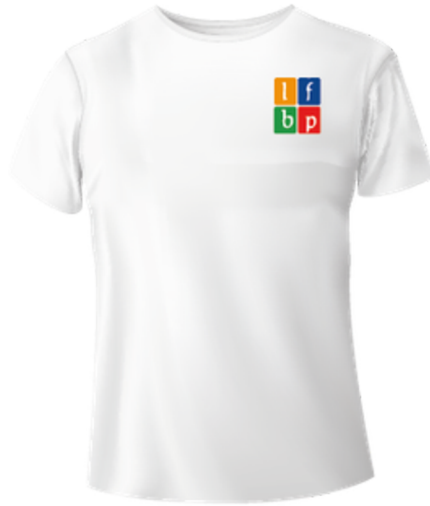
T-shirt blanc col rond avec le logo carré de l'établissement.