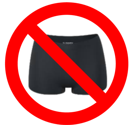
Pas de shorty