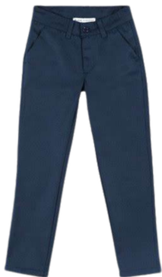
Pantalon droit bleu marine, (pas de jean, ni de collant, ni de stretch)

Polo ou t-shirt blancs avec le logo carré de l'établissement