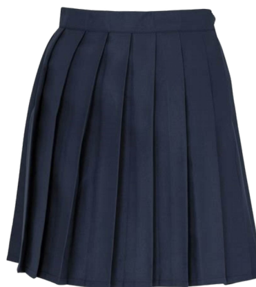
Jupe plissée bleu marine hauteur genoux